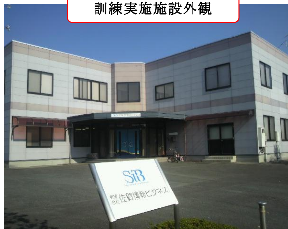
訓練実施施設外観